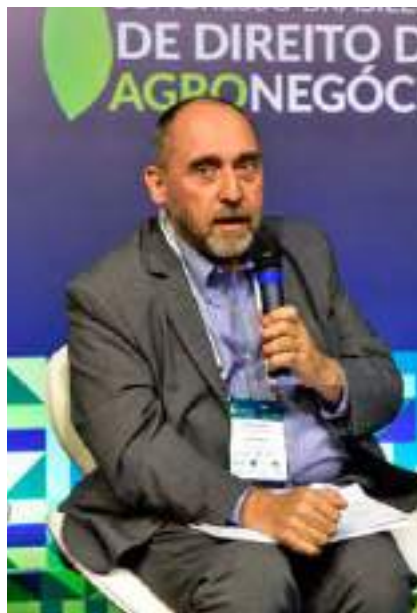
Luís Inácio Lucena Adams, Advogado-Geral da União entre 2009 e 2016