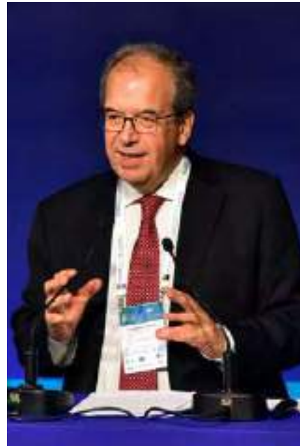
Ricardo Villas Bôas Cueva, Ministro do Superior Tribunal de Justiça (STJ)

Ele reforçou que o painel trouxe a perspectiva de todo o espectro que atende o sistema de agronegócio: desde quem toma o risco de crédito, quem está na ponta produtiva acessando o crédito, o próprio Judiciário - na medida em que tem o desafio de pacificar essas relações judicializadas - e as Cortes Superiores no estabelecimento de precedentes.