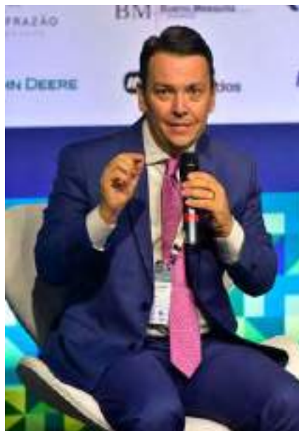
Thiago Castelliano, Juiz de direito do Tribunal de Justiça do Estado de Goiás (TJGO)

“O financiamento do agronegócio é uma construção institucional que permite ao setor expandir exponencialmente e ganhar competitividade global. A segurança jurídica não é um valor abstrato, é uma condição concreta para que o crédito circule.”