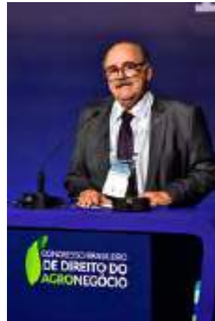
Sérgio Bortolozzo , Presidente da Sociedade Rural Brasileira – SRB