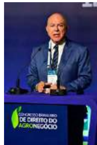
Arnaldo Jardim, Deputado Federal, Vice- presidente da Frente Parlamentar da Agropecuária – FPA

“As cooperativas estão presentes hoje em todos os elos da cadeia, desde a comercialização, industrialização e a produção agropecuária, conectando o produtor rural ao mercado.”