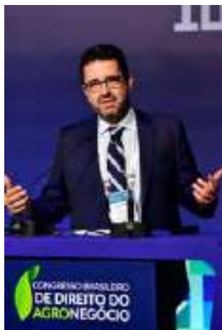
Geraldo Melo Filho, Secretário de Agricultura e Abastecimento do Estado de São Paulo