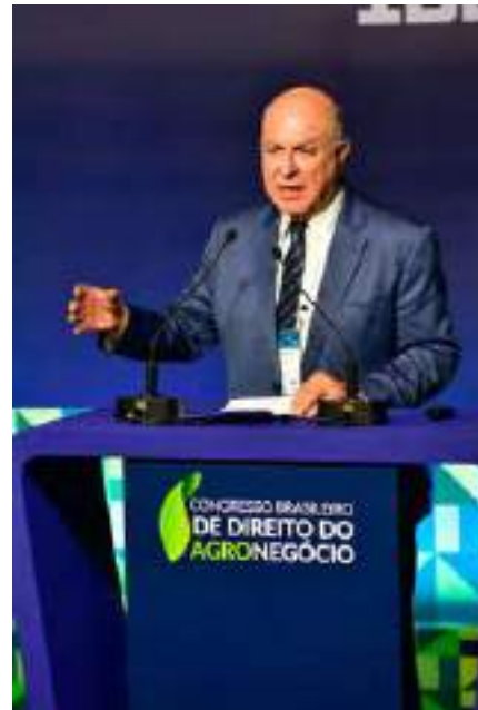
Deputado Federal Arnaldo Jardim, vice-presidente da FPA

O deputado federal Arnaldo Jardim , vice-presidente da FPA, defendeu o Código Florestal como instrumento central para conciliar produção e preservação. Elencou iniciativas legislativas recentes — Lei de Licenciamento Ambiental, Lei dos Combustíveis do Futuro e instrumentos de mercado de capitais voltados ao clima — e alertou que a cobertura de seguro agrícola no Brasil caiu de 11,3% para cerca de 7% da área plantada nos últimos três anos, tornando urgente uma política pública robusta para o setor.